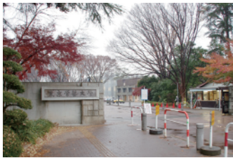
東京学芸大学正門