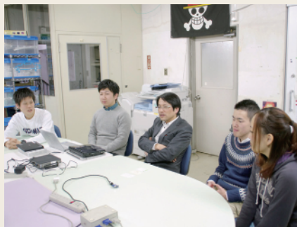
森本研究室の皆さん