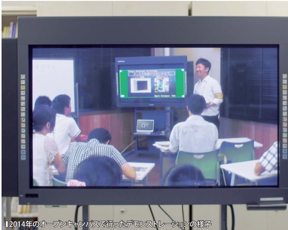
【2014年のオープンキャンパスで行ったデモンストレーションの様子】