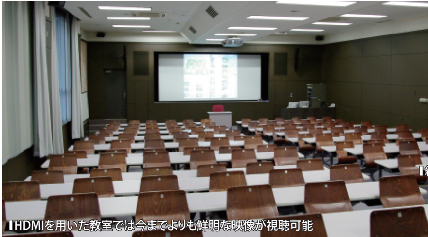
【HDMIを用いた教室では今までよりも鮮明な映像が視聴可能】