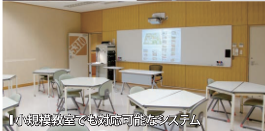
【小規模教室でも対応可能なシステム】