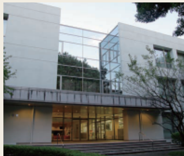
設備を全面リニューアルした視聴覚センター