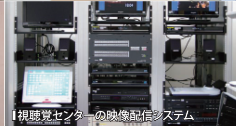
【視聴覚センターの映像配信システム】