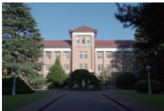
津田塾大学小平キャンパスの本館